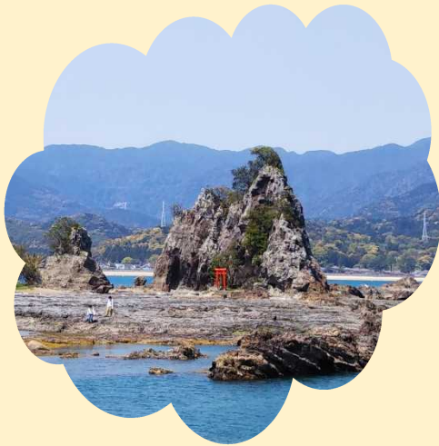
潮位によってなかなか渡れない「弁天島」!